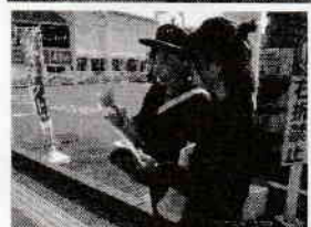
谷山電停前活動状況

JR 坂之上駅及び同駐輪場においては、地域安全モニターが、鹿児島南警察署生活安全課と地域課員と合同で利用客に対し、無施錠自転車の防犯指導、痴漢・盗撮被害防止のチラシを配布して指導しました。(写真右上)