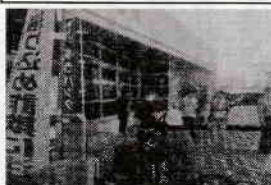
喜入郵便局前活動状況