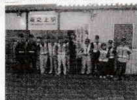
坂之上駅前活動状況