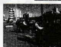
発生防止ポスターの掲示活動状況

11月5日(水)鹿児島みらい農協協同組合谷山北支店において、強盗対処訓練を実施しました。